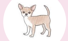
南国原産の犬種、シングルコート(単毛)、小型犬など