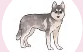
寒い地域原産の犬種、ダブルコート(二重毛)や大型犬など

犬は、人間に比べて比較的寒さに強いと言われています。しかし犬種や年齢によっては寒さが苦手な子も。また人間よりも低い位置で生活している上、お腹の毛が少ないため下から来る寒さには敏感です。居住空間を整えるなどして、寒さ対策を実施しましょう。