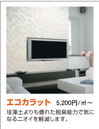
エコカラット 5,200円/㎡～ 珪藻土よりも優れた脱臭能力で気になるニオイを軽減します。

お住まいの中のニオイ対策なら「エコカラット」がおすすです。空気をきれいにするデザインタイル「エコカラット」は、ペットの排便のニオイや生ゴミの腐敗臭など、悪臭の原因物質（アンモニアや硫化水素、トリメチルアミン、メチルメルカプタン）を吸着し、お部屋の空気をさわやかに保ちます。また「エコカラット」には空気中の有害物質VOC（揮発性有機化合物）を吸着し低減する効果があるので、ご家族にも愛犬にも安心です。